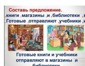
Рисунок 2. Примеры содержания видеороликов. Работа над текстом.