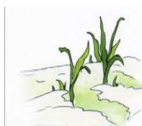
Весной прилетают птицы.