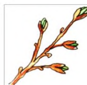
Ребята делают скворечники.