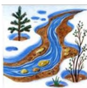
Скоро появятся листочки.