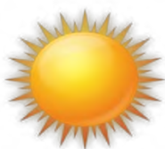
Ярко светит солнце.