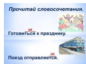
Рисунок 3. Примеры содержания видеороликов. Орфоэпия.