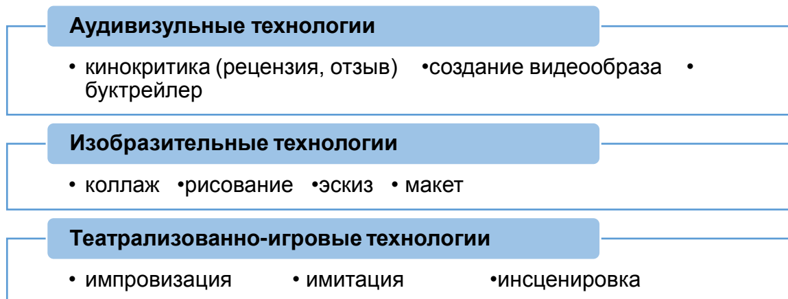
Рисунок 1. Виды арт–технологий.

относятся аудиовизуальные технологии, изобразительные технологии, театрализованно–игровые технологии [4].