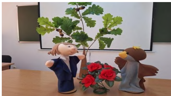
Рисунок 3. Сказка «Соловей и роза».

творческий потенциал одних учащихся и убрать психологические барьеры у других. Они себя чувствуют более комфортно, потому что «поет» кукла. Финал сказки драматичен, и дети не хотят, чтобы соловей умирал. Учитель может предложить придумать сценку, в которой студент спасает умирающую птицу. Ребята с удовольствием придумывают новый финал сказки, создают свой сценарий и играют роли.