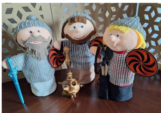
Рисунок 2. Групповой проект. РАФТ.

Так дети работают над созданием образа и знакомятся с новой для них профессией. Следует добавить, что на уроках по этой теме я применяла аудиовизуальную технологию (создание образа) и изобразительную технологию (рисование эскиза).