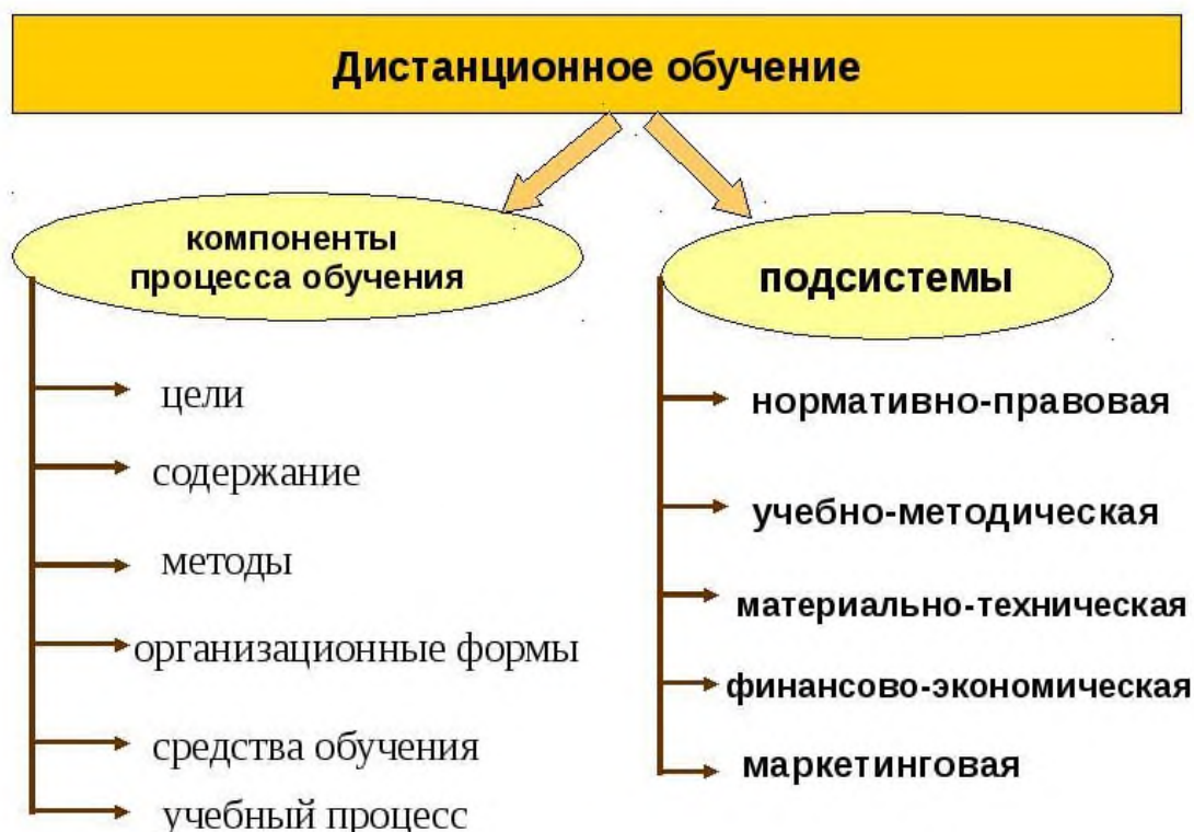
Рисунок 1. Дистанционное обучение.

Дистанционное обучение имеет ряд преимуществ: