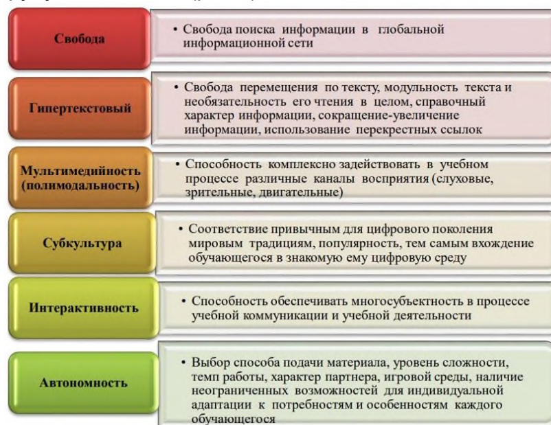
Рисунок 1. Дидактические особенности цифровой образовательной среды школы

учащихся в образовательный процесс создают инновационные модели обучения художественному труду школьников (рис.1).